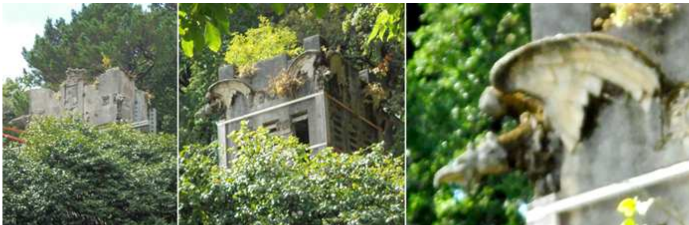
❶ Este pazo o palacete está en ruinas y actualmente en obras para recuperarlo. ❷ Una de las torres del conjunto. ❸ Las gárgolas de esta torre son águilas con las alas desplegadas

Este pazo propiedad del que fuera político Ramón Gutiérrez de la Peña, construido por el arquitecto modernista Jesús López Rego, a la entrada de la finca cuenta con un robleal con 250 ejemplares. Además de castaños, magnolios, o camelias algunas de bastante porte y antigüedad.