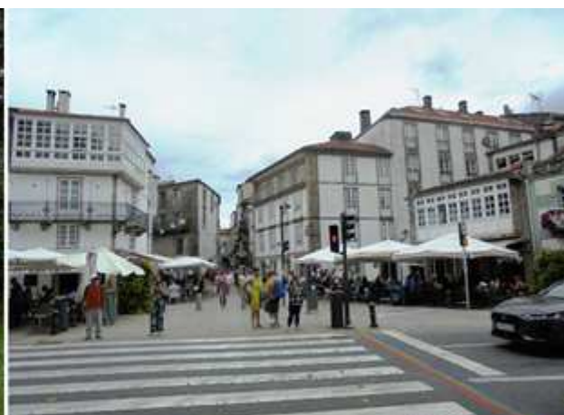
❶ Paisaje y mural de un artista que ha captado el mismo. ❷ Y llegamos al principio del parte, Porta Ferreira y la Rúa de los Francos.