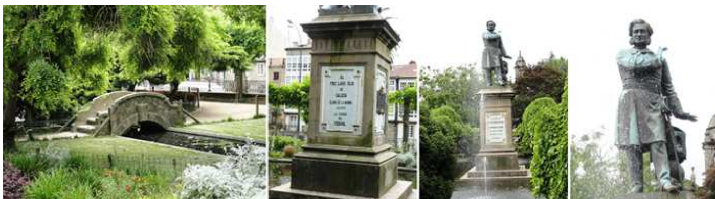
1 Puentecillo de piedra. 2 Monumento al glorioso militar marino gallego. 3 Casto Méndez Núñez. 4 Estatua del héroe del Callao.

Un pequeño recorrido por este remanso de paz por sus jardines, parterres, o pérgolas, donde las fuentes, estanques o quioscos de música se combinan.