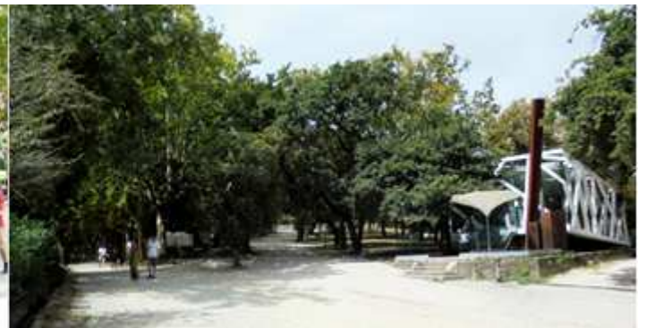
1 Dispone de varios paseos amplios. 2 Con diferentes tipos de arbolado. El paseo arbolado inicial y la robleda fueron lugar de las ferias y fiestas de la Ascensión y el Apóstol