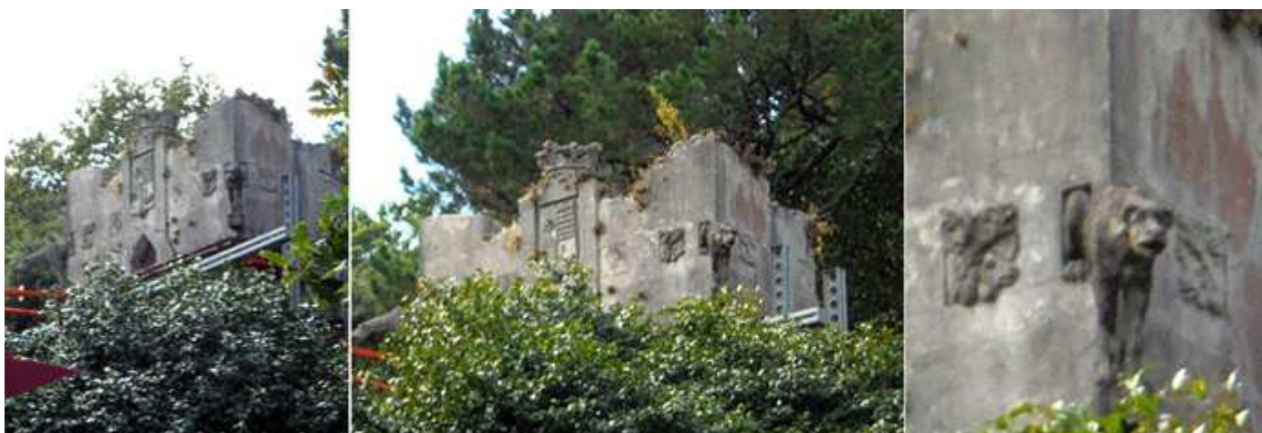
❶ La parte del cuerpo central que posee un puerta ojival. ❷ Y sobre la misma ostenta un escudo con una corona real. ❸ Este edificio sus gárgolas son mamíferos.