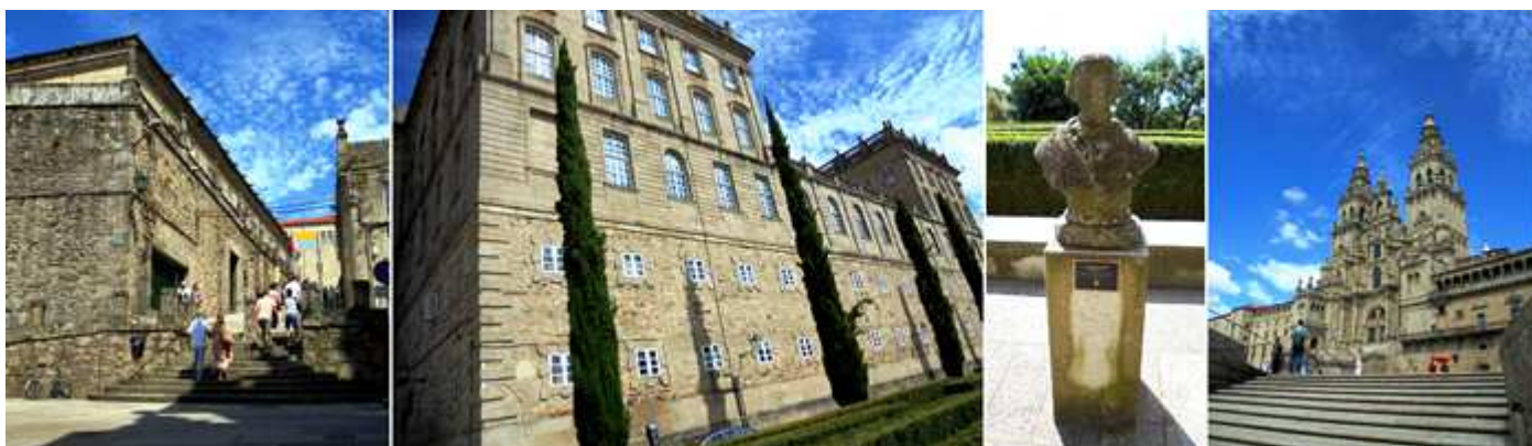
❶ Rúa Costa do Río por donde bajamos de la plaza del Obradoiro, al principio de esta mañana. ❷ Fachada posterior del Palacio Raxoi (sede de la Junta de Galicia y del Ayuntamiento) con los jardines. ❸ Busto de Concepción Arenal en los jardines tras la parte posterior del Palacio Raxoi-2020. ❹ Escaleras de acceso a la plaza del Obradoiro, junto al pazo de Fonseca (a la derecha)