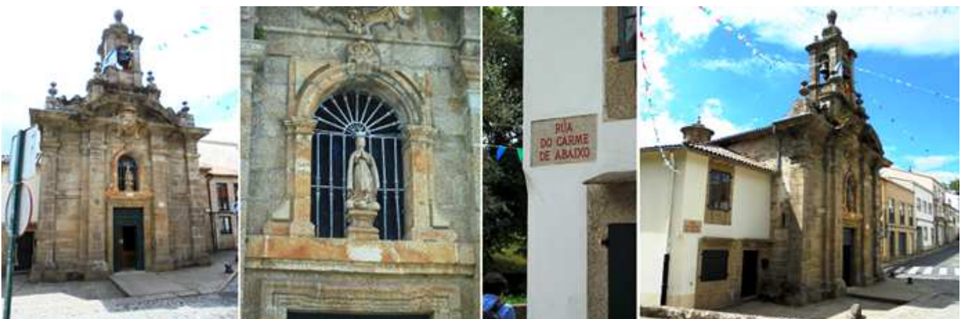
❶ Fachada de la Iglesia de San Fructuoso. Dividida en tres cuerpos con dos pares de gruesas columnas adosadas al espacio central. Y con sendos pináculos sobre su entablamento y frontis curvo. ❷ Hornacina con una verja y ante ella la talla de la Virgen del Carmen. ❸ Su fachada en la calle rúa del Carmen de Abaixo. ❹ Vista de esta rúa con el templo.

Su construcción se efectuó en el S. XVIII en estilo Barroco clasicista.