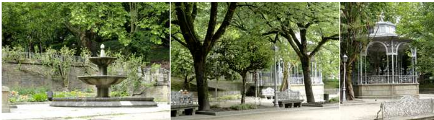
1 Una de sus fuentes de esta parte inicial del parque que tiene una extensión de 56.087m 2 . 2 Parque que también tiene un interés botánico. 3 Quiosco de música.

Un pequeño recorrido por este remanso de paz por sus jardines, parterres, o pérgolas, donde las fuentes, estanques o quioscos de música se combinan.