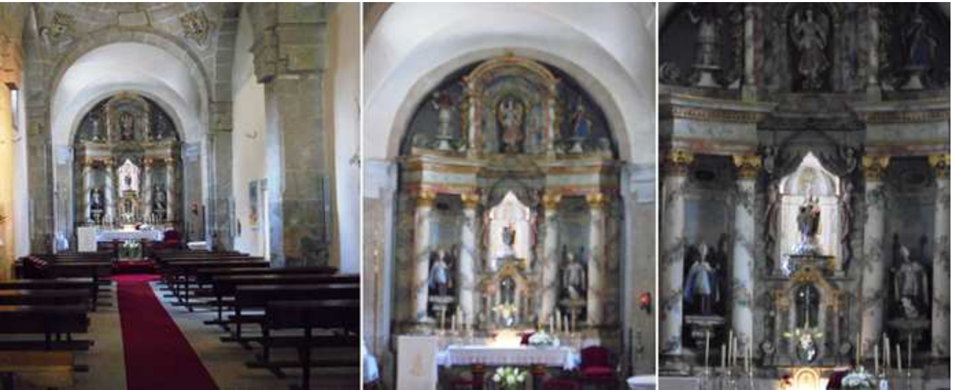
❶ Sobre gruesas columnas rectas que soportan los arcos de su cubierta. ❷ Retablo de tres calles y dos pisos en el altar Mayor. ❸ Entre las columnas de las calles laterales sendos obispos con báculos, y en la central la Virgen del Carmen con el Niño y rodeada de angelitos que sostienen las cortinas de esta hornacina y sobre ella la figura de San Miguel en el ático..

La fachada, en sillería de granito, consta de tres cuerpos verticales enmarcados por pilastras, y tres cuerpos horizontales. En la parte central del conjunto corona con una torre de planta cuadrada, que esta rematada con pináculos y volutas.