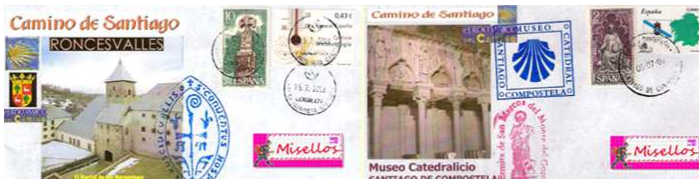
❶ Colegiata de Roncesvalles (Navarra) Obliteración estafeta de Jaurrieta 15.07.09 + sello Hospitalario de Roncesvalles ❷ Museo Catedralicio Santiago de Compostela. Obliteración estafeta de Santiago de Compostela 06.07.09 + sellos Ermita San Marcos y Museo Del primer camino.