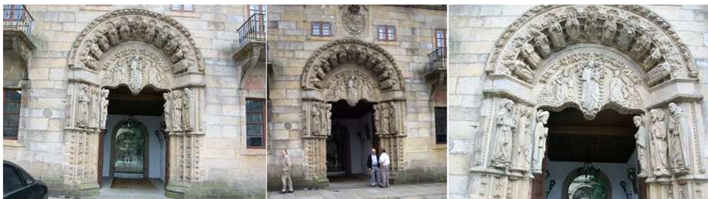
❶ Portada donde predominan las imágenes de Santiago San Juan San Pablo y San Pedro. ❷ Portada de puro estilo románico con influencias del gótico sobre la misma esta el escudo de su fundador el arzobispo Fonseca. ❸ En el tímpano la figura central la Virgen con el Niño.

Entre los espacios del mismo dispone de claustro, capilla y Salón de Grados con un artesanado mudéjar. La portada pertenecía al antiguo Hospital de Peregrinos del S. XV. Adosado al colegio de San Jerónimo (también llamado colegio de Artistas) se le conoce como Pazo de Fonseca, y como Colegio de Santiago Alfeo con acceso por Rúa de Franco.