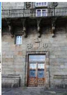
❶ Un gran balcón recorre la fachada. ❷ Flaquean la puerta Adán y Eva padres de la humanidad. ❸ Las grandes cadenas ante su fachada y que separan la plaza, delimitaba que los peregrinos el espacio que estaban bajo la jurisdicción del Hospital, y por lo tanto