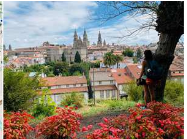
1 Croquis con el plano del trazado Camino Portugués y el Parque de la Alameda donde está el mirador. 2 Una de sus vistas con la torre de la Catedral de fondo.

Adentrados en el parque desde este punto nos vamos a internar aun más por el mismo.