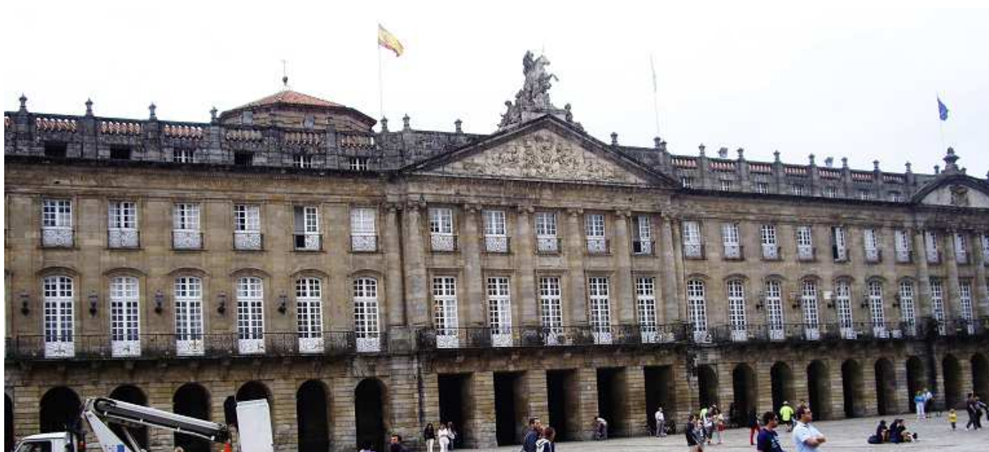
❶ Plaza del Obradoiro, Palacio de Rajoi S.XVIII.

El palacio de Rajoi fue construido en el S. XVIII su colosal fachada a la plaza del Obradoiro, esta culminada en la parte central con un frontis triangular donde está representada la batalla de Clavijo, y sobre la misma, la figura ecuestre del apóstol Santiago. Hoy es la sede del Ayuntamiento y de la Presidencia de Gobierno de la Junta de Galicia.