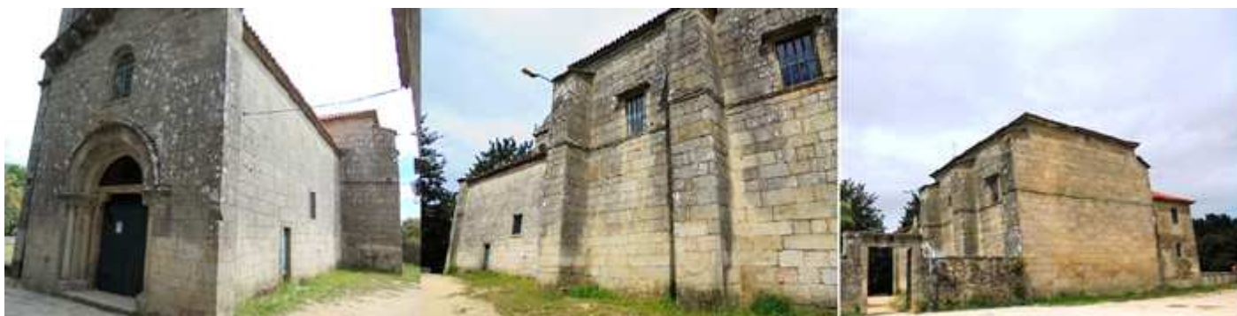
❶ Vista de la fachada y el lateral de su Epístola orientado al sur. ❷ Lateral epistolar con la puerta al fondo que posee un dintel pentagonal románico. ❸ Cabecera y puerta del recinto que da a esta campa de la "carballeda".

Otros testimonios románicos del templo son un dintel en la puerta sur, su ventana del hastial, las cruces que aún conserva de consagración en sus muros interiores, o los dos canecillos geométricos que tiene utilizados como ménsulas.