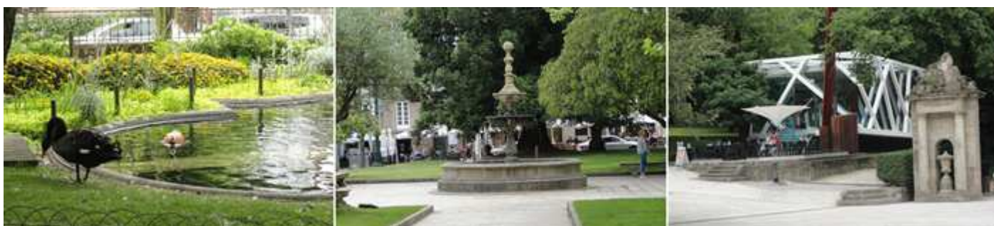
1 Un pequeño estanque con algunas aves acuáticas. 2 Otra de sus fuentes sobre la parte central. 3 la alameda está distribuida en tres paseos.

Esta parte inicial con plantaciones de plátanos y camelias se le conoce como Campo de la Estrella.