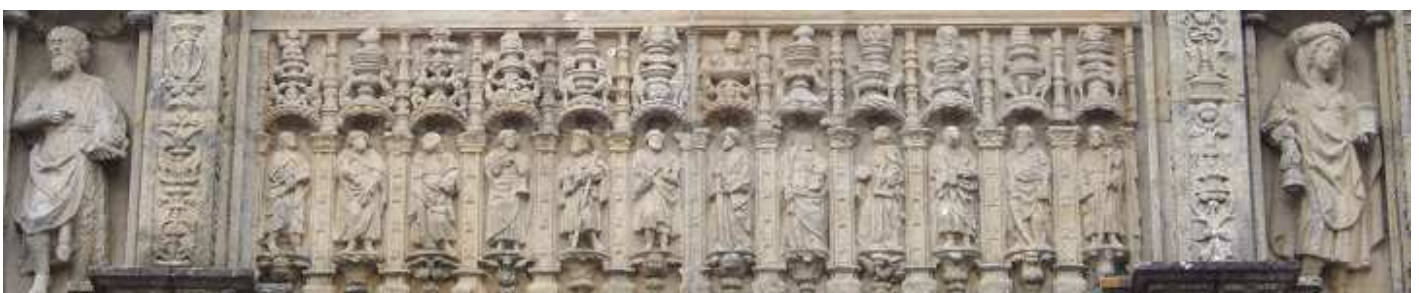
❹ En la parte central los doce apóstoles.

En el lado norte de la plaza, fue hospital hasta en S: XIX y en el XX se convirtió en Parador Nacional.