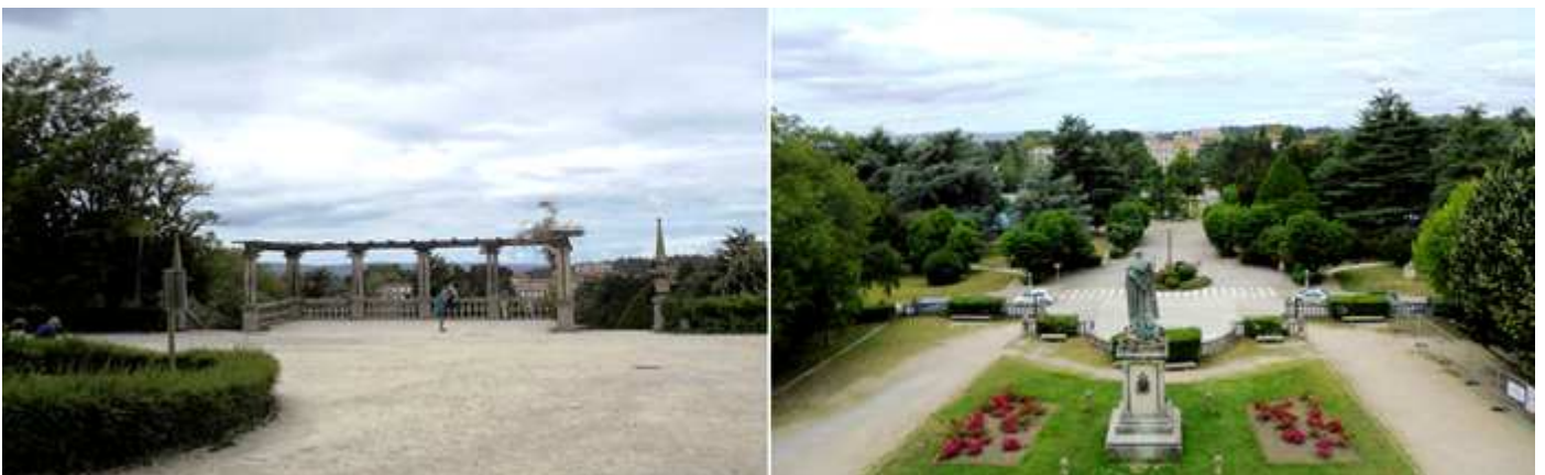
❶ El mirador que por su altura ofrece unas inmejorables panorámicas, sin olvidar el otro mirador que en la otra punta de esta "carballeda" ofrece de la catedral y casco viejo en el paseo de la Herradura (Ferradura). ❷ Una de las vistas de su parte inferior.