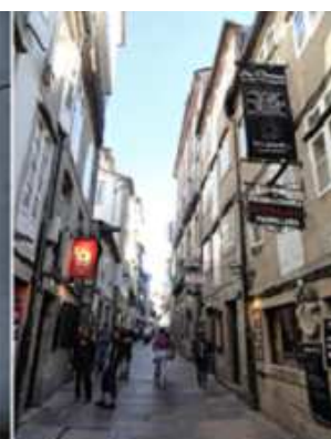
❶ Puerta Ferreira entrada de la Rúa Franco. ❷ Igualmente los comercios de recuerdos y souvenir proliferan en estas calles. ❸ Algunos de los mesones populares “A Charca” o del recorrido “Paris-Dakar” en la ronda de vinos a lo largo de esta rúa que comienza y termina con el nombre de los bares.

La Rúa do Franco termina en la Plaza del Obradoiro. A media calle se encuentra el edificio de Correos