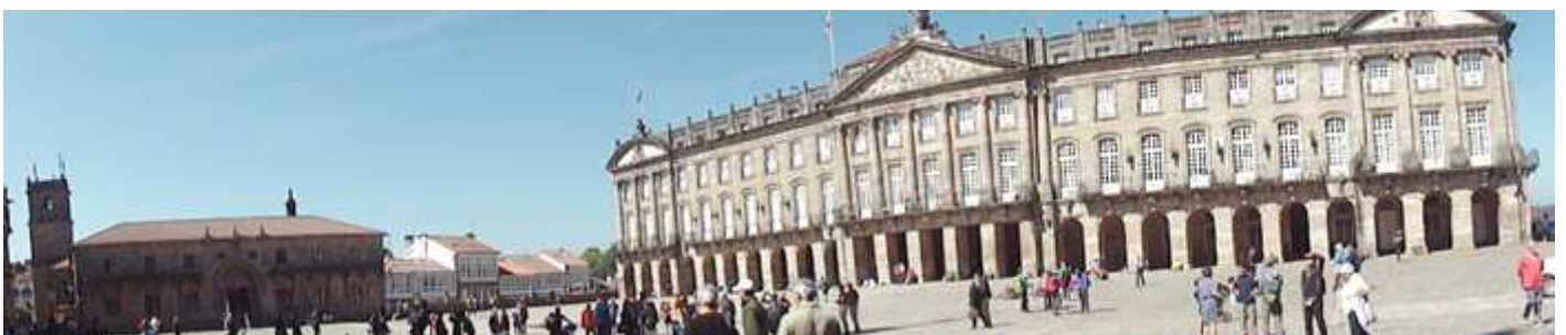
❸ Panorámica de la plaza del Obradoiro, con el palacio Rajoi y a la izquierda el Colegio de San Jerónimo.

En un lateral de esta plaza del Obradoiro tenemos el Hostal de los Reyes Católicos, que nació como hospital para los peregrinos en 1499, dispone de cuatro claustros y una capilla ojival. En el encontramos en su construcción líneas góticas, renacentistas y barrocas. Esta disposición de atender a los peregrinos tiene constancia en el friso superior: “El actual edificio fue mandado construir en 1501 por los Reyes Católicos para atender a los enfermos y peregrinos del divino Jacobo”