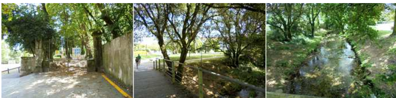
❶ Entrada al pazo. ❷ Y tomamos este paseo de regreso. ❸ Tramo con el río encauzado

Dejamos el parque para retornar hacia la plaza del Obradoiro, más o menos por el mismo camino.