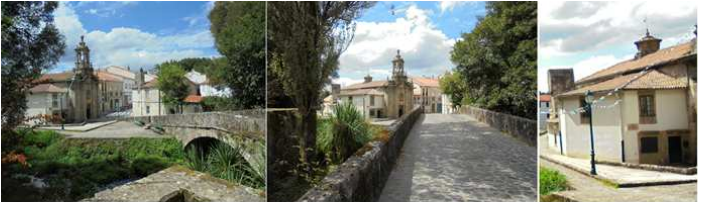
❶ Llegamos al río Sarela y cruzamos su punto. ❷ Sencillo puente de un arco rebajado. ❸ Lateral exterior del templo del Evangelio.

Por el lateral del Hostal de los Reyes Católicos tomamos la calle rúa das Hortas (esta es la salida del Camino a Finisterra) cruzamos la Avda. de las Galeras y tras un corto paseo descendente llegamos a la ribera del río Sarela.