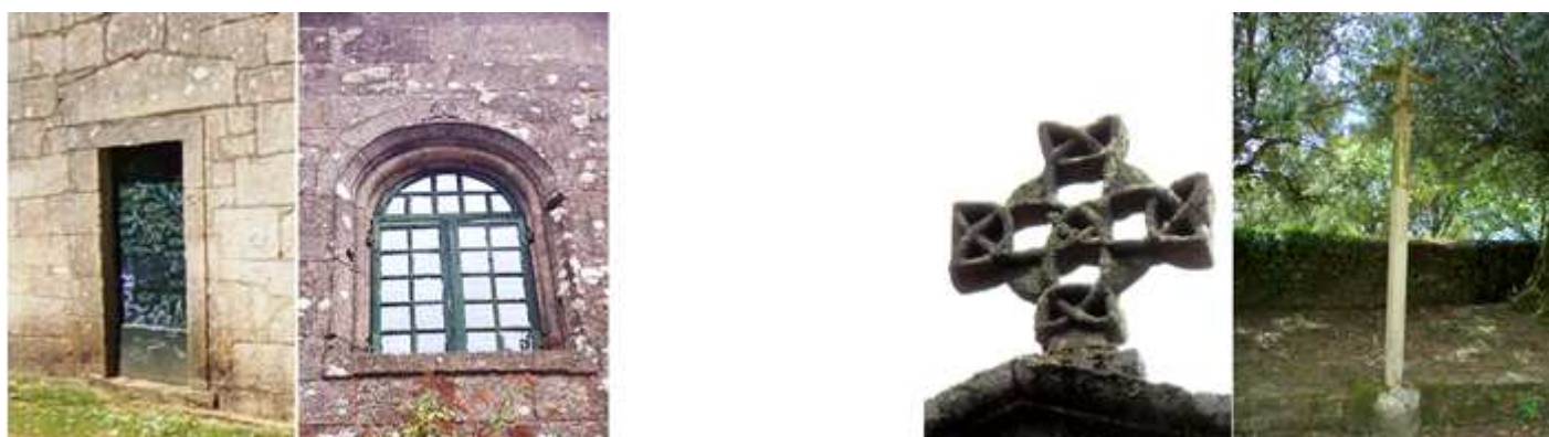
❶ Dintel pentagonal en la pequeña puerta del lado sur. ❷ Sencilla ventana sobre su puerta. ❸ Cruz patada de Consagración del templo, en un sillar lateral de la puerta epistolar sobre la pila de agua bendita. Y en el muro hay dos más y en opuesto también encalado están preservadas varias más todas en su interior. ❹ Cruz gótica el ápice de la nave sobre un pedestal cuadrangular. ❺ Crucero en el terreno vallado de la Iglesia de Santa Susana, en esta zona pasaba el Camino Real de Pontevedra. Crucero sin plataforma con un pedestal redondo lo mismo que su varal, con una cruz de brazos rectos con terminaciones patadas.

Otros testimonios románicos del templo son un dintel en la puerta sur, su ventana del hastial, las cruces que aún conserva de consagración en sus muros interiores, o los dos canecillos geométricos que tiene utilizados como ménsulas.