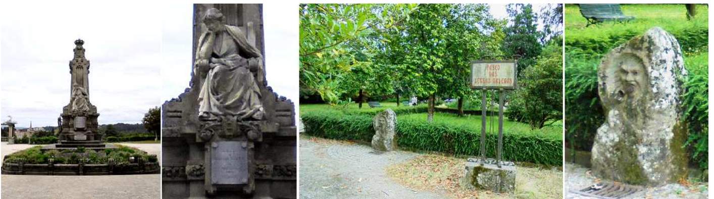
❶ De camino al mirador una gran plataforma que esta a notable altura y se alza el Monumento a Rosalía de Castro ❷ Con la inscripción: Adíós ríos; adíós fontes; adíós regatos pequenos; adíós vista dos neus olios; non sei cando nos veremos. Prados, ríos, arboradas, pinares que fnove o vento, paxariños piadores, casiña do meu contento. Adíós, Virxen da Asunción branca común serafín; levós no corazón; pedidelle a Dios por min, niña Virxe da Asunción.. ❸ Paseo de las Letras Gallegas. ❹ Y una fuente con la posible cara de un literato.

Desde el Castro o Campo de Santa Susana propicia la vista, el valle del Sar con su colosal y curioso templo de su colegiata de Santa María del Sar. Que bien merece una visita por la proximidad a la ciudad, andando o con los autobuses urbanos. En la explanada del mirado esta el monumento a la escritora Rosalía de Castro.