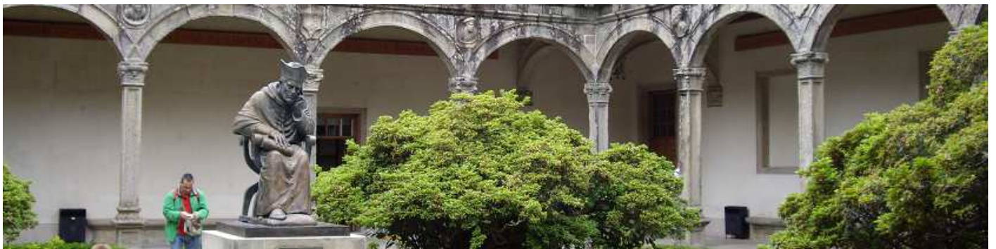
1 Claustro de Colegio de Fonseca, que pertenece a la Universidad Compostelana,

La ciudad no deja indiferente a nadie, con la prioridad que prevalece el ambiente que rodea a los peregrinos del Camino de Santiago, lo cultural está presente para unos y para otros. En cuanto a los placeres gastronómicos, es tan amplia la oferta que hay para todos los bolsillos, por sus mariscos y pescados, como en los productos cárnicos o de su huerta.