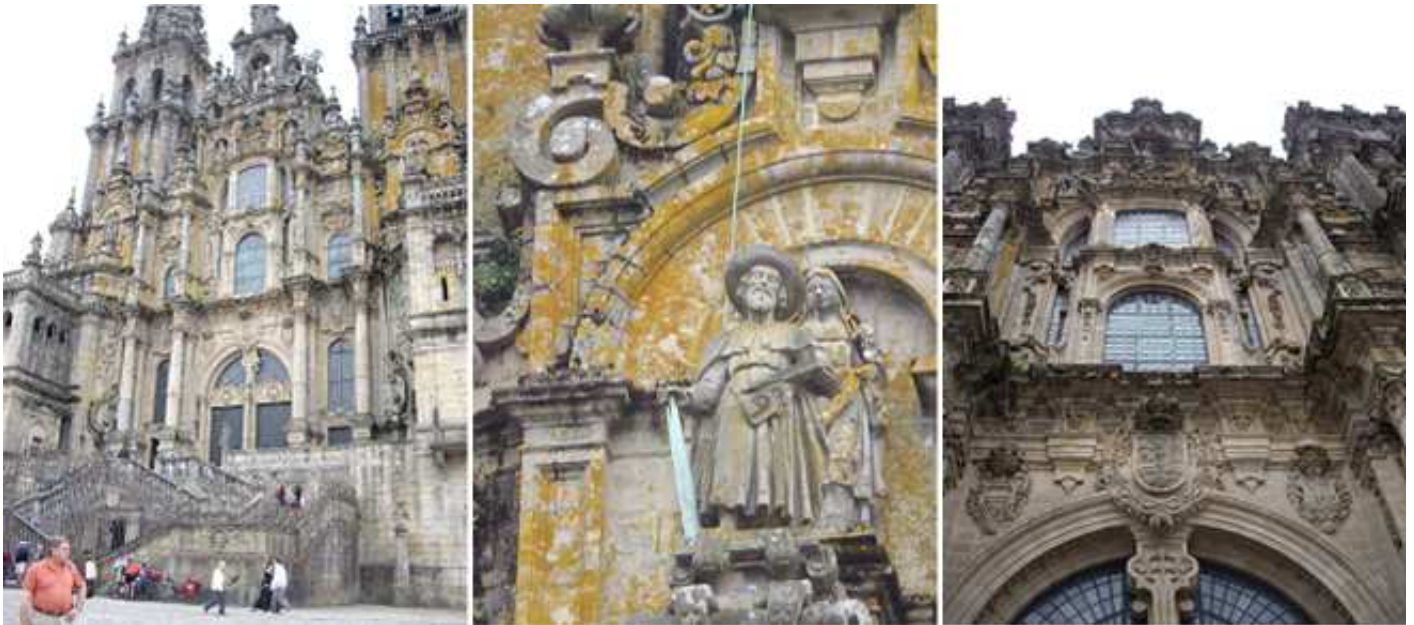
❶ La fachada de la catedral de 1790 . Esta fachada Oeste del Obradoiro fue construida en el S. XVIII para proteger el Pórtico de la Gloria es obra de Fernando de Casas Novoa. ❷ Imagen de Zebedeo padre de Santiago en la torre izquierda. ❸ Parte superior de la misma esta el apóstol Santiago con sus dos discípulos San Anastasio y San Teodoro.

La Catedral, cuya construcción se inició en la época de mayor esplendor de Santiago, en 1075, estamos ante uno de los monumentos más importantes, tanto a nivel artístico como religioso europeo. Templo de origen románico con importantes muestras a lo largo del mismo, y que evoluciona a lo largo del tiempo en diferentes estilos, especialmente el barroco.