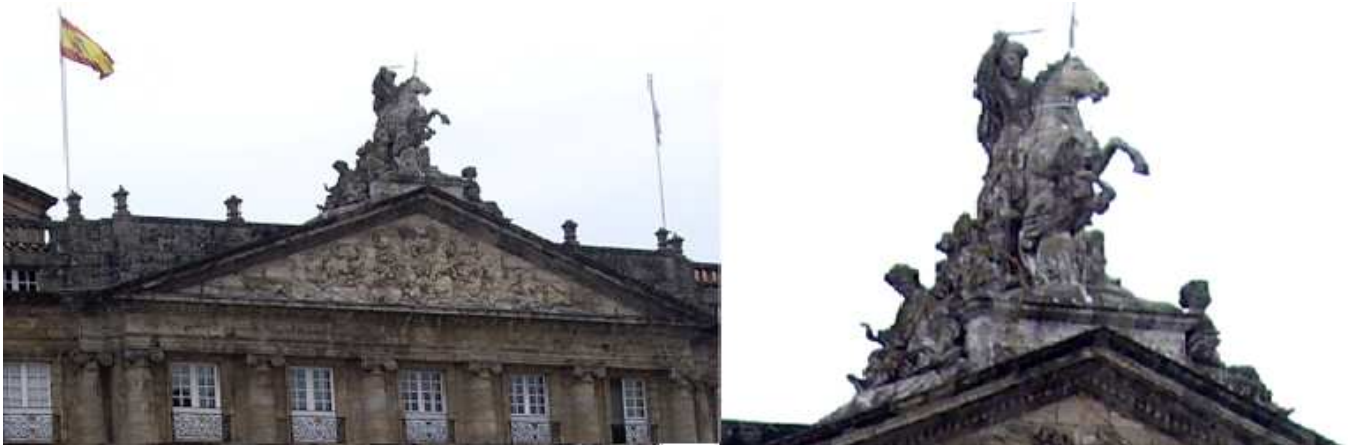
❶ En el friso la representación pétrea de la Batalla de Clavijo. ❷ La imagen de Santiago a caballo sobre el frontis.

Este edificio de estilo neoclásico lo mando construir el arzobispo de la ciudad Bartolomé Rajoi Losada en el año 1766.