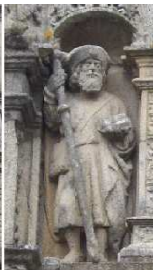
❶ En su maravillosa portada plateresca, están representados varios santos entre los que se encuentran Cristo, María, Santiago, San Juan Bautista, M a Magdalena, los 12 Apóstoles, Adán y Eva...hasta un coro de ángeles Y el Padre Eterno estaba en el espacio de una ventana. ❷ Parte central con las hornacinas de los santos . ❸ Imagen del Apóstol Santiago en la segunda hornacina empezando por la izquierda a la altura de la ventana que era el aposento de los reyes cuando visitaban Compostela, hay una segunda imagen del apóstol sobre el friso que hay sobre la puerta con los doce apóstoles, es el 5º por la izquierda.

En la parte central se encuentran los 12 apóstoles.