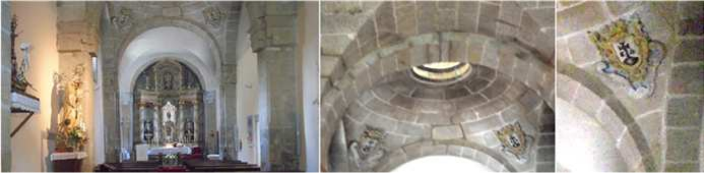
❶ Su nave con una decoración sencilla. ❷ Detalle de su cúpula con linterna. ❸ Sobre pechinas con el escudo de la Orden del Carmelo.

La fachada, en sillería de granito, consta de tres cuerpos verticales enmarcados por pilastras, y tres cuerpos horizontales. En la parte central del conjunto corona con una torre de planta cuadrada, que esta rematada con pináculos y volutas.