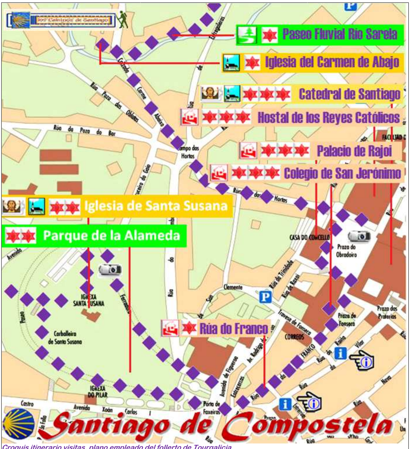
Croquis itinerario visitas, plano empleado del follerto de Tourgalicia.

SANTIAGO DE COMPOSTELA (VII) Parque de la Alameda, Iglesia Santa Susana, Puerta Ferreira, Rúa do Franco, Plaza del Obradoiro, Iglesia del Carmen de Abajo, y Paseo Fluvial Río Sarela..