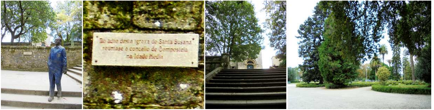
❶ Monumento a García Lorca. ❷ Lapida que indica de las reuniones del concejo que se realizaban aquí. ❸ Escaleras a la iglesia. ❹ Toda esta parte está muy bien cuidada y arbolada con parterres.

Desde el Castro o Campo de Santa Susana propicia la vista, el valle del Sar con su colosal y curioso templo de su colegiata de Santa María del Sar. Que bien merece una visita por la proximidad a la ciudad, andando o con los autobuses urbanos. En la explanada del mirado esta el monumento a la escritora Rosalía de Castro.