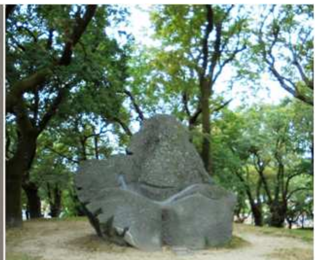
1 Plano con los puntos más interesantes dentro del Parque de la Alameda 2 Monumento a Castelao abril 1995.