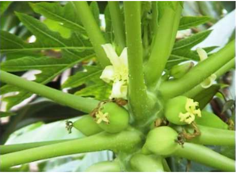
1 Hay especies de diferentes partes del mundo.

Se completa con una representación de la fauna en sus estanques y sobre todo de pavos reales.