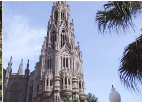
1 - 2 - 3 Diferentes perspectivas de su exterior donde destacan las agujas de sus torres.