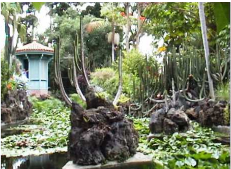
2 Detalle del quisco junto al lago.