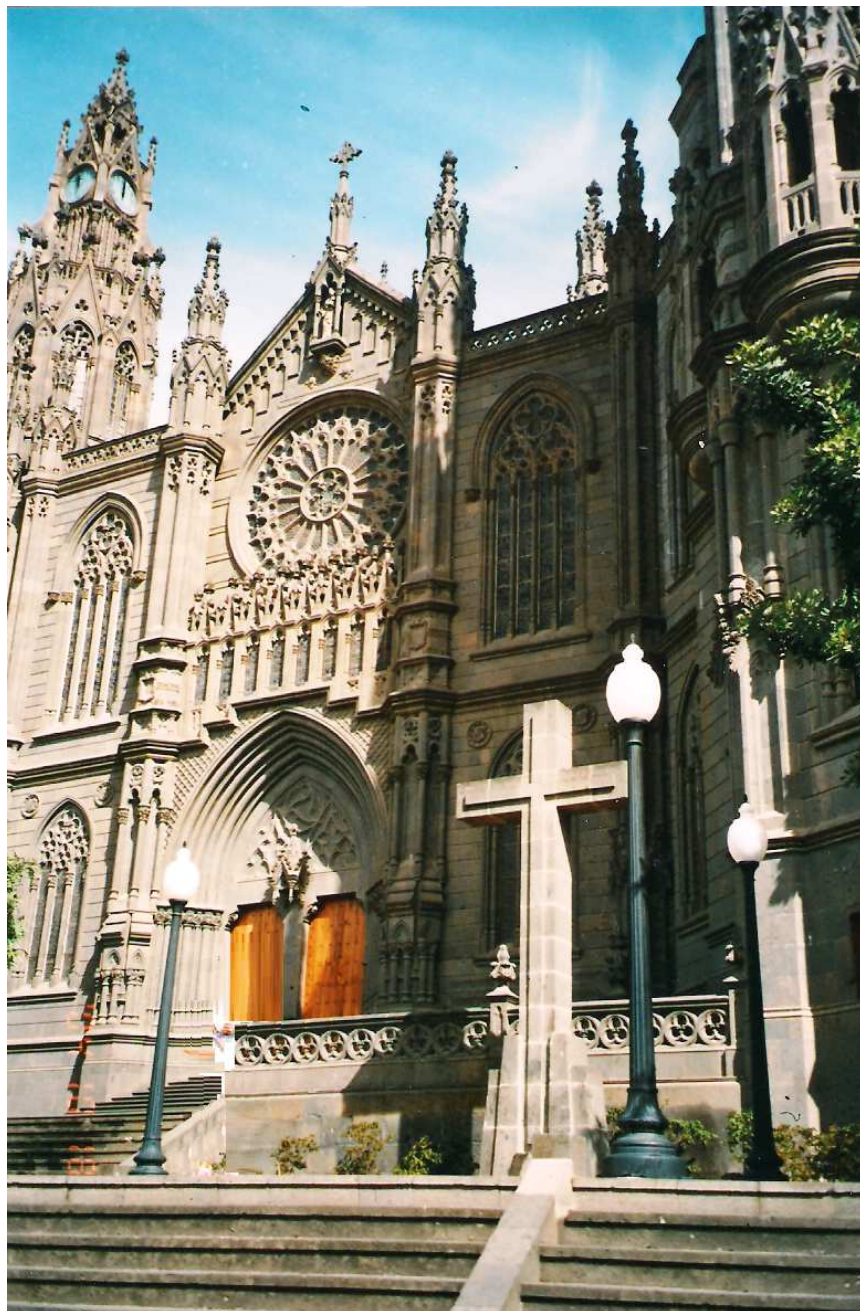
Fachada de la Iglesia de San Juan Bautista en Arucas