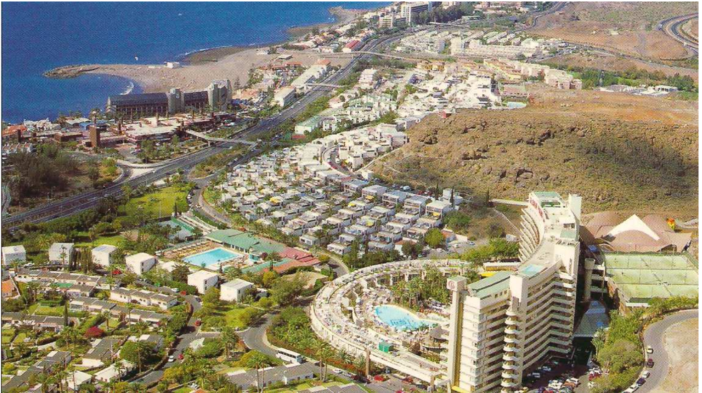
1 Vista aérea del hotel y las urbanizaciones próximas.

Nuestra primera salida, la realizamos a escasos kilómetros del hotel y además aprovechando el microbús que el hotel pone para desplazarse a la playa. Maspalomas tiene una de las playas más amplias y limpias, partiendo de costa Meloneras o desde el faro, nos adentraremos en un ecosistema de dunas y palmeral, donde anidan cantidad de aves, en este espacio protegido.