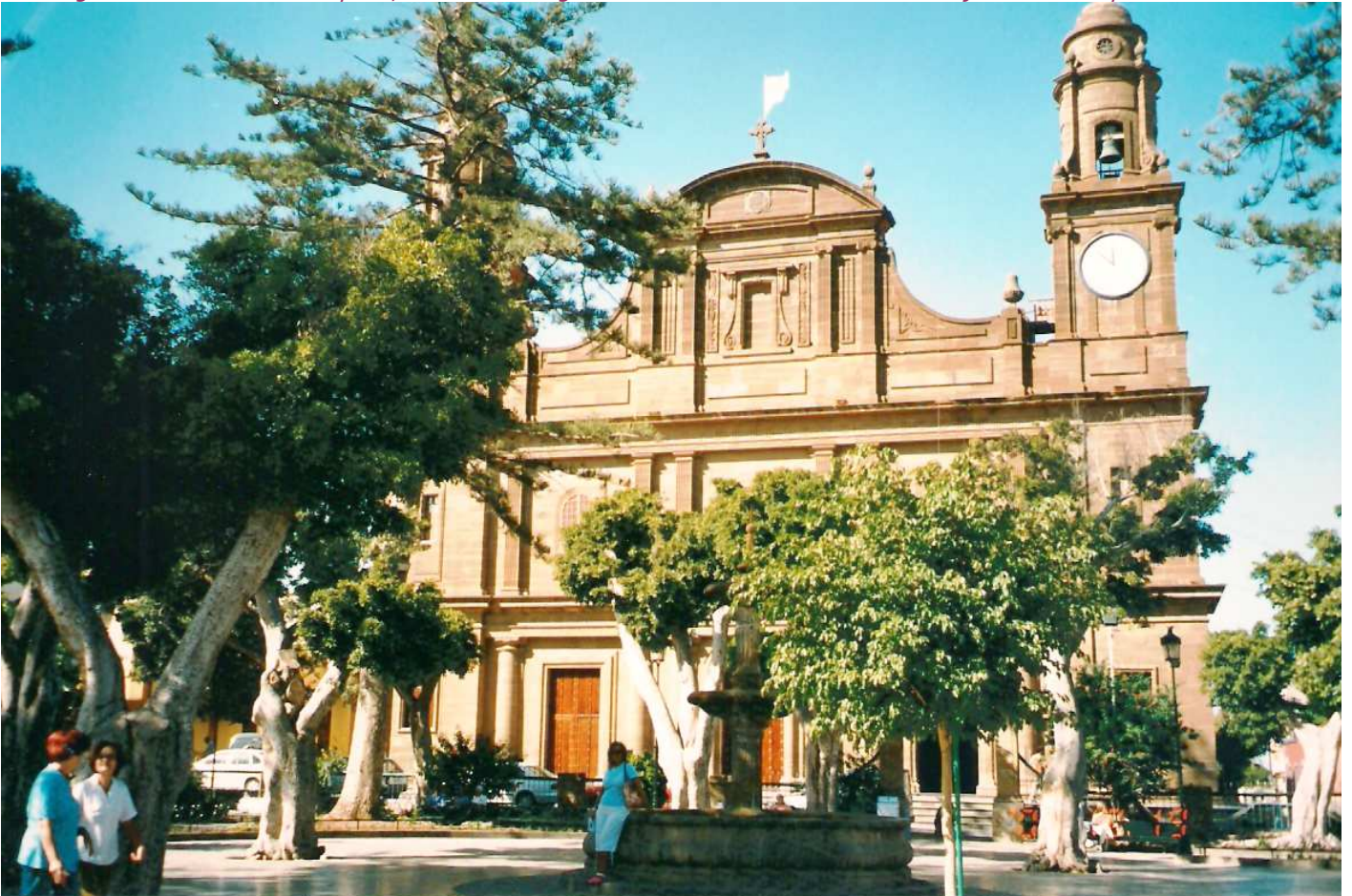
❶ Iglesia de Santiago, con tres puertas la “Santa” la de Santiago y la de la Purísima Concepción. En su fachada destaca el frontis y su dos torres gemelas.