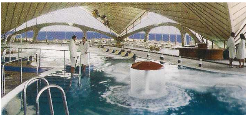
❷ Dotado con unas instalaciones de talasoterapia.