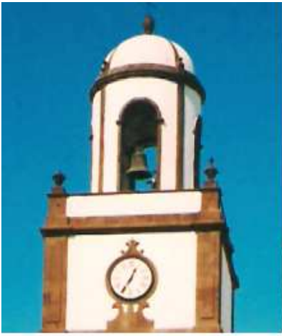
1 - 2 Fachada de la Iglesia de la Concepción.