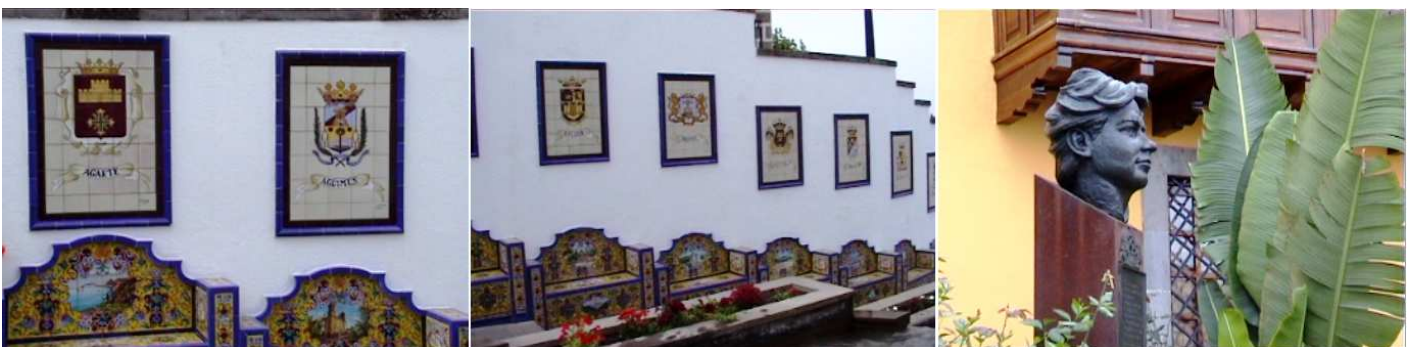
❶ Mosaicos de los murales con los escudos de las localidades. ❷ En el centro es donde discurre la cascada de agua. ❸ Ya junto la plaza de la Iglesia.

Firgas localidad que merece una visita para recorrer su casco urbano con su Iglesia de San Roque.