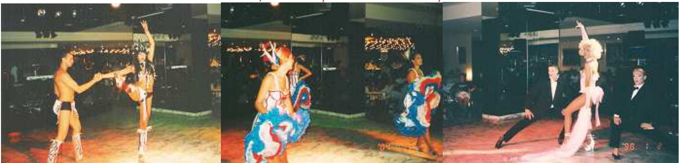
1- 2 - 3 Otra de las actuaciones.