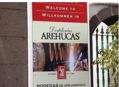
1 Entrada de la bodega.

Esta fabrica fue fundada el 9 de agosto de 1884, su interior es un autentico museo, por las numerosas personalidades que la han visitado y dejado constancia de su presencia. La maquinaria para su instalación fue trasladada desde Glasgow, y su primera molienda de caña se realizo al año siguiente.