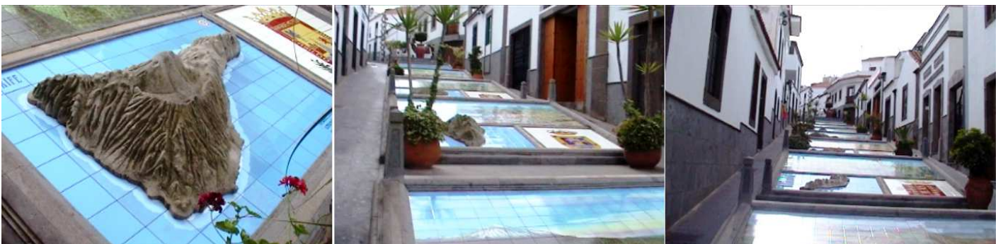
❶ Con una representación en relieve de cada isla. ❷ Un tramo son las islas, y el otro es el de la cascada de agua. ❸ Todo está muy cuidado y como si estuviera recién pintado.

En uno de los lados de sus paredes se encuentran los 22 escudos heráldicos que representa a los municipios de Gran Canaria.