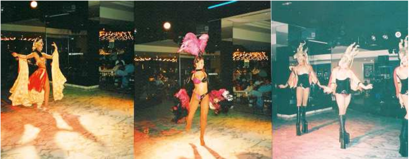
1 - 2 - 3 Una de las características de este hotel, eran los espectáculos nocturnos que cada día había diferentes.