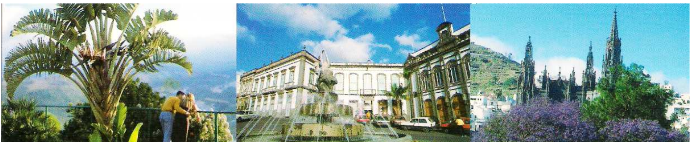
1 Desde el mirador.

Fue fundada a comienzos del S. XVI. Está situada en la fachada norte de la isla, en un valle que fue configurado por un volcán. Y tiene dos parques naturales, el Parque Gourie junto el casco histórico y el Jardín de la Marquesa, del S. XIX, como jardín botánico.