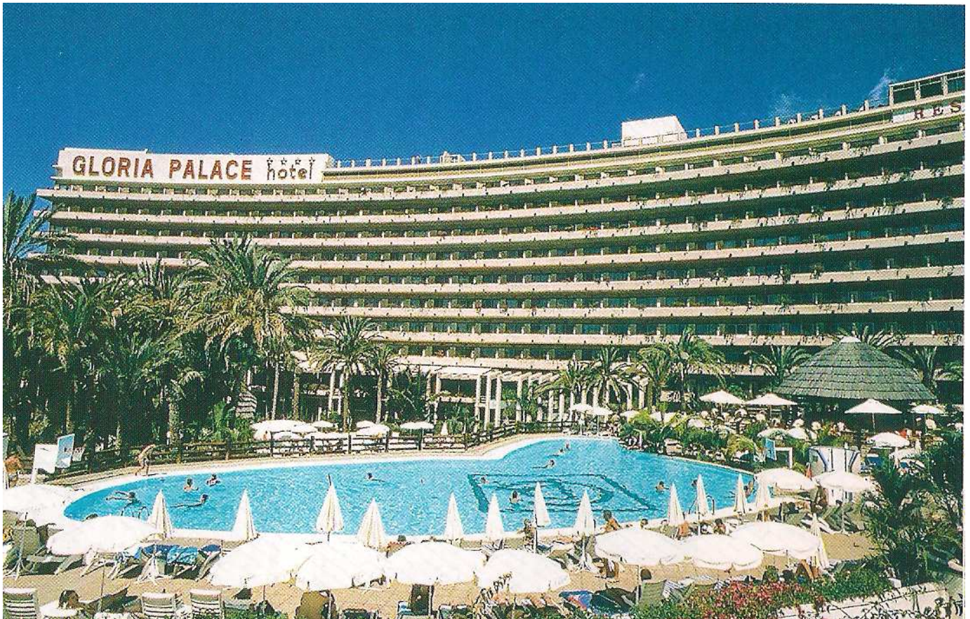
❶ Panorámica del hotel, foto de un folleto publicitario.