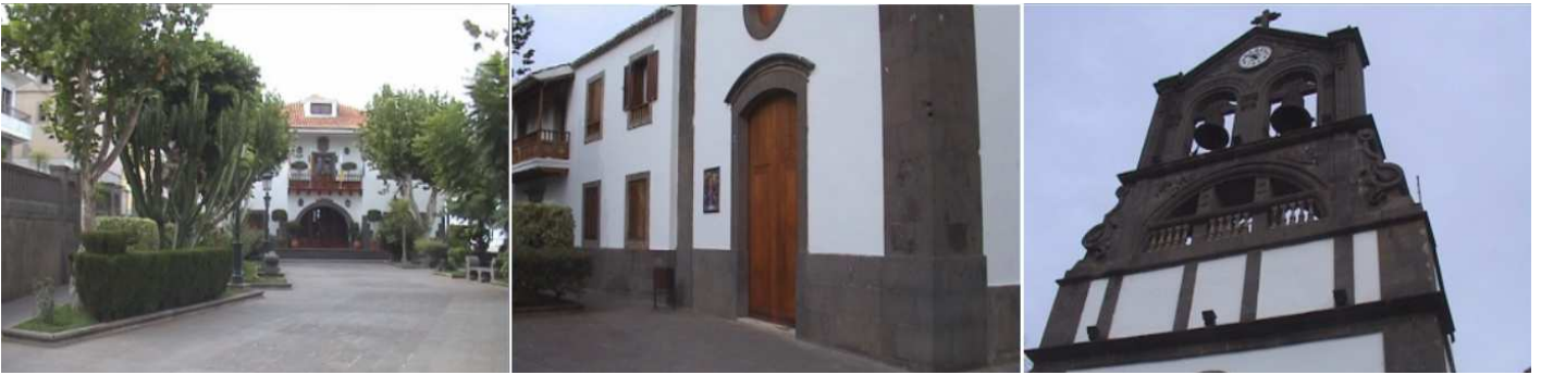
❶ En la plaza de San Roque. ❷ - ❸ Iglesia de San Roque, con una amplia espadaña con piedra de Arucas.

Ahora nos trasladamos al municipio de Firgas, donde podemos apreciar la construcción de sus casas y el original paseo de Gran Canaria.