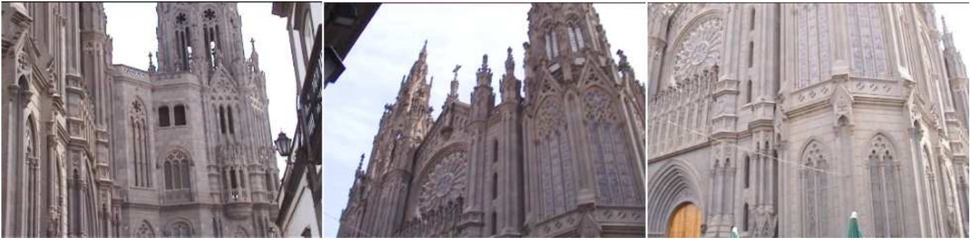
❶ Lateral exterior del lado de la Epístola ❷ Segundo cuerpo de la fachada y su rosetón ❸ Con ventanas con vidrieras.