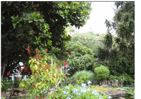
3 Otra zona frondosa.