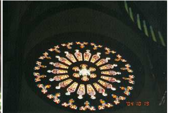
❷ Una de su vidrieras del rosetón de la fachada principal.

A la riqueza que representan los labrados de columnas y capiteles se unen unas hermosas cristaleras