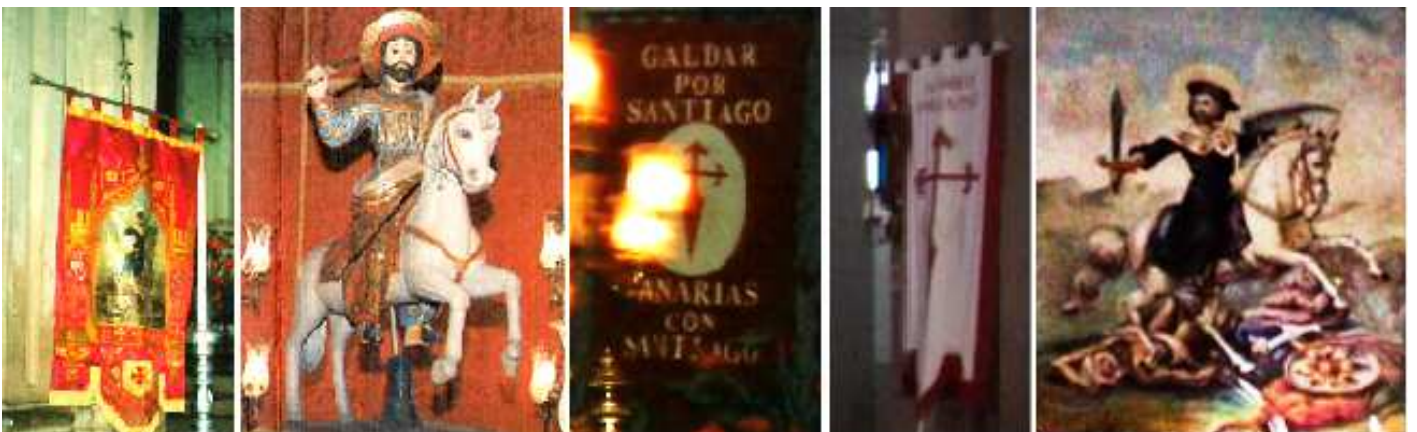
1 Estandarte 2 Figura ecuestre de Santiago en su capilla 3 - 4 Otros estandartes. Y pendones jacobeos 5 Imagen de Santiago, de la escuela canaria del S. XVII.