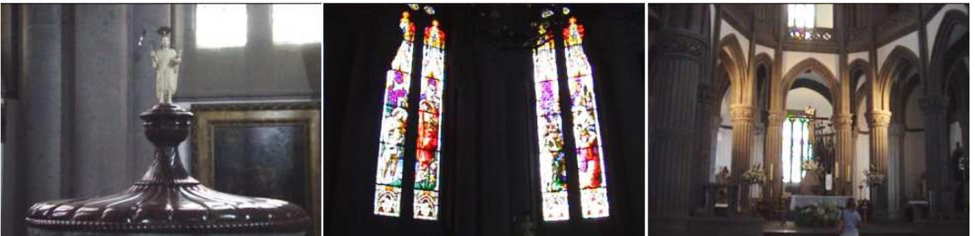
1 Pila bautismal en el baptisterio. 2 Sus vidrieras. 3 El Altar Mayor y la parte del ábside.

Está dotada con hermosas vidrieras, y construida con piedra del lugar.