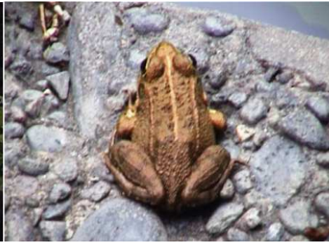
2 Y sus "diferentes" animalitos.