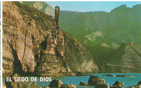
2 El Dedo de Dios.