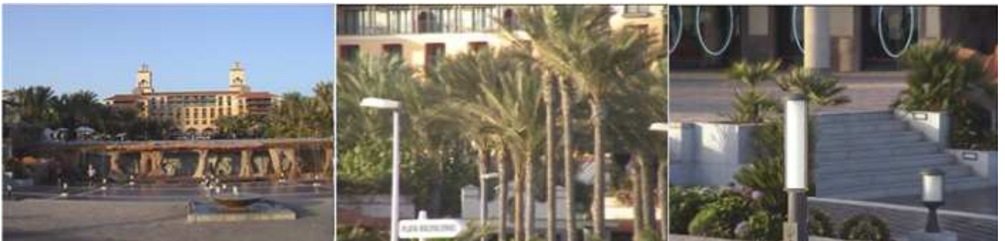
1 Ante uno de los más importantes hoteles. 2 Paseo hacia la playa y dunas de Maspalomas. 3 Junto a uno de los faros.

Entre costa Meloneras y Playa del Inglés esta está zona donde se encuentra unos de los ecosistemas producidos por las dunas tanto estables como movibles, con una flora y vegetación autóctonas. Y en la parte que están agrupados los hoteles, se disfruta de un agradable paseo por los jardines que bordean la costa.