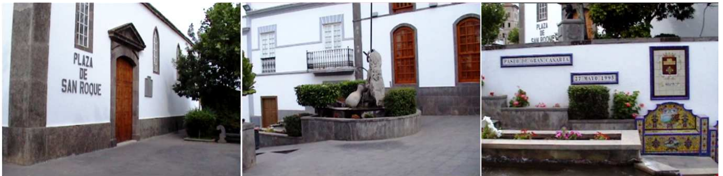
❶ Otro rincón de la plaza. ❷ Uno de los monumentos, se encuentra otro a San Juan de Ortega. ❸ El Paseo de Gran Canaria.

Plaza con la casa del ayuntamiento y aquí estaba el convento dominico, ya desaparecido