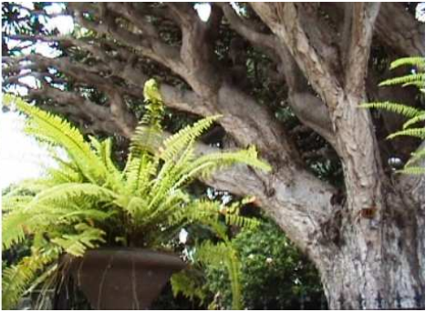
3 Algunos árboles han conseguido un porte espectacular.

Una gran tranquilidad, rodea los estanques y arboleda y ofrecen rincones inimaginables