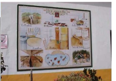
3 Diferentes procesos para la obtención del ron.