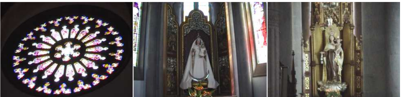
1 Otra vista del rosetón de su fachada. 2 Capilla de la Inmaculada Concepción, 3 Capilla Virgen del Carmen.

La Iglesia neogótica se levanta en dos cuerpos, teniendo cuatro fachadas, enmarcadas entre dos torres agudas.