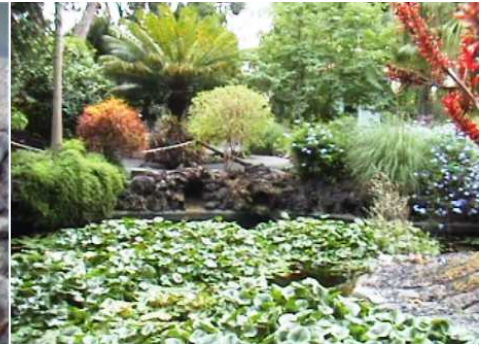
3 Un estanque.

Se completa con una representación de la fauna en sus estanques y sobre todo de pavos reales.