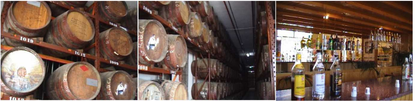
❶ Distintas barricas de roble., dedicadas a los visitantes ilustres de esta bodega. ❷ Algunas de ellas con originales dedicates. ❸ Sala de degustación de sus elaborados.

Nos efectúan una visita guiada por las instalaciones más interesantes, para culminar con una degustación de sus productos al final de la visita.