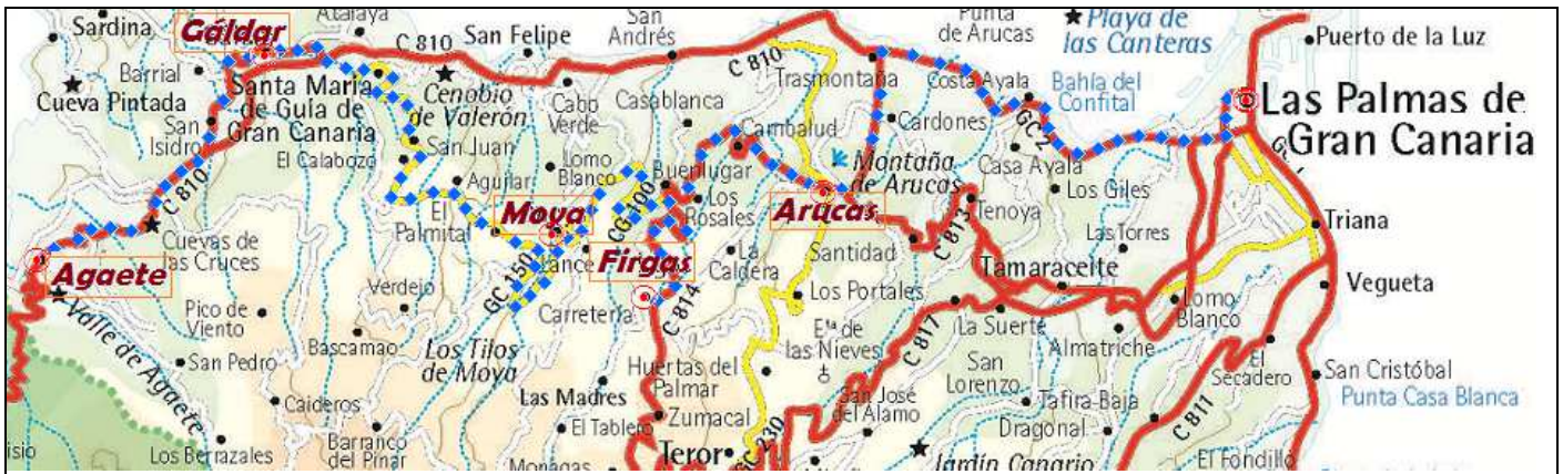
Plano utilizado del Gobierno de Canarias (Turismo)