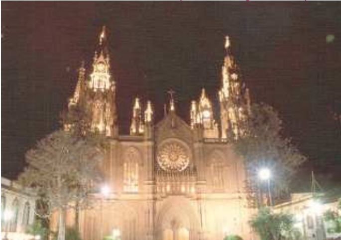
❶ Imagen nocturna de la Iglesia de San Juan Bautista.