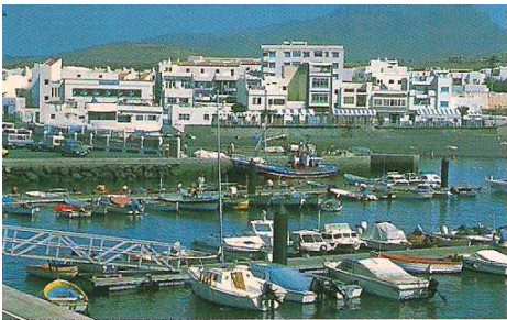
1 Puerto de las Nieves.

En su casco histórico, están los edificios más notables de la población junto a la Iglesia de la Concepción. Y nos acercamos al puerto de las Nieves para apreciar el fenómeno natural de constitución rocosa del Dedo de Dios, que surge del mar