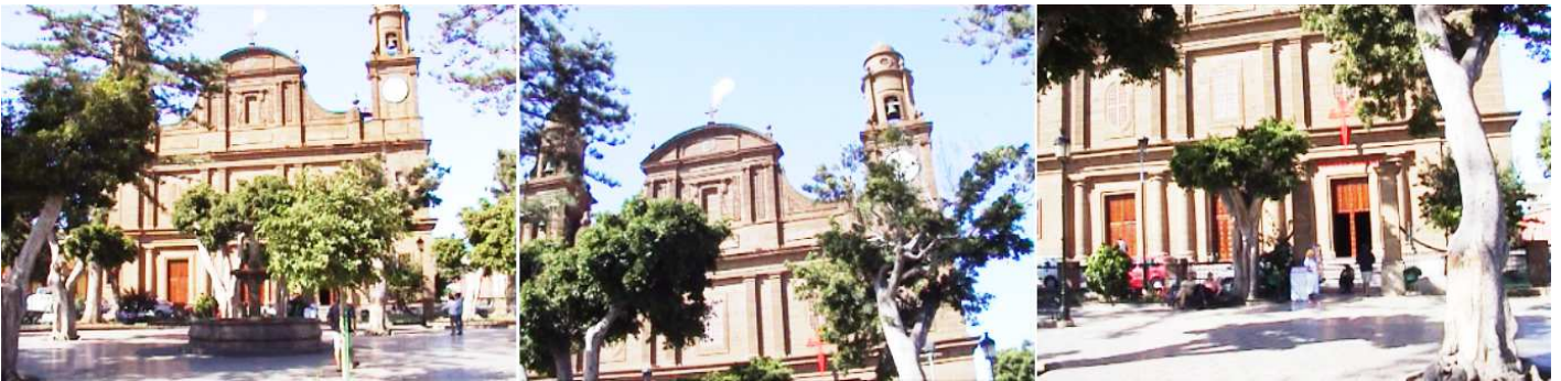
❶ Una gran fachada se abre a la plaza, con dos torres gemelas ❷ Con un enorme frontón rebajado. ❸ Y sus puertas clasicistas.

Templo neoclásico realizado entre 1778 y 1824, con influencias barrocas, consta de tres naves, que están cubiertas con bóvedas de medio cañón y una gran cúpula sobre el crucero donde está la capilla mayor