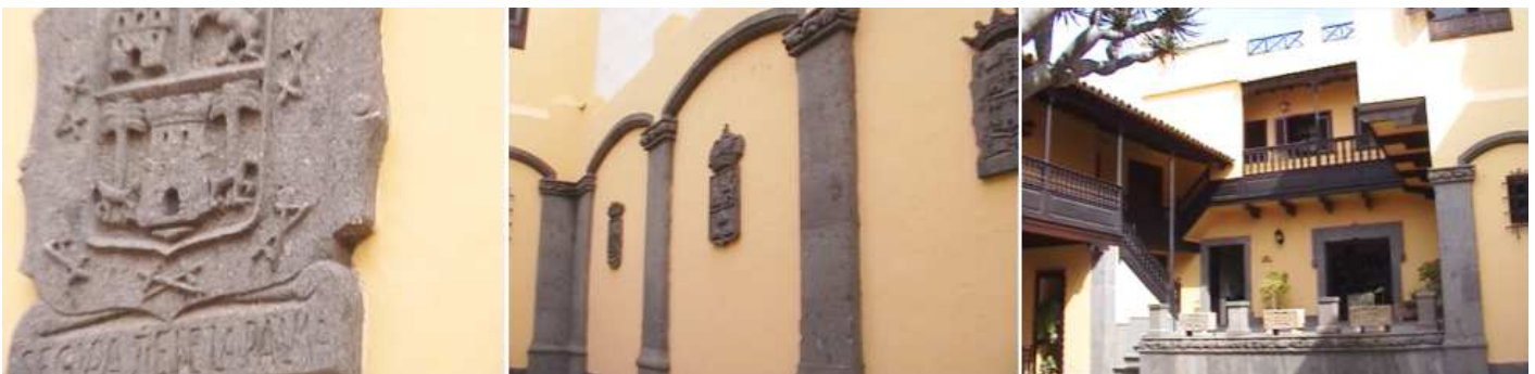
❶ - ❷ Lateral con unos escudos ce piedra.

Salimos al exterior y recorremos sus calles