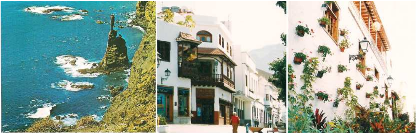
❶ El Dedo de Dios. (que ya no existe debido a un temblor de tierra que lo tumbó, posteriormente a la visita) ❷ Ante una de las casas típicas con Balcón. ❸ Toda la calle es un vergel de flores.

Da gusto pasear por algunas de sus calles, pues la ornamentación floral, en algunas es numerosa.