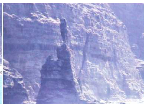
1 Desde el puerto a mano derecha delante de los acantilados se aprecia el Dedo de Dios. 2 - 3 Sobre una arista de roca que emerge del mar, se suspende (suspendida) esta formación rocosa. Cuando actualizo este post, tuvo un derrumbe y no está. GRAN CANARIA, San Agustín, Maspalomas, Arucas, Firgas, Moya, Gáldar y Agaete.