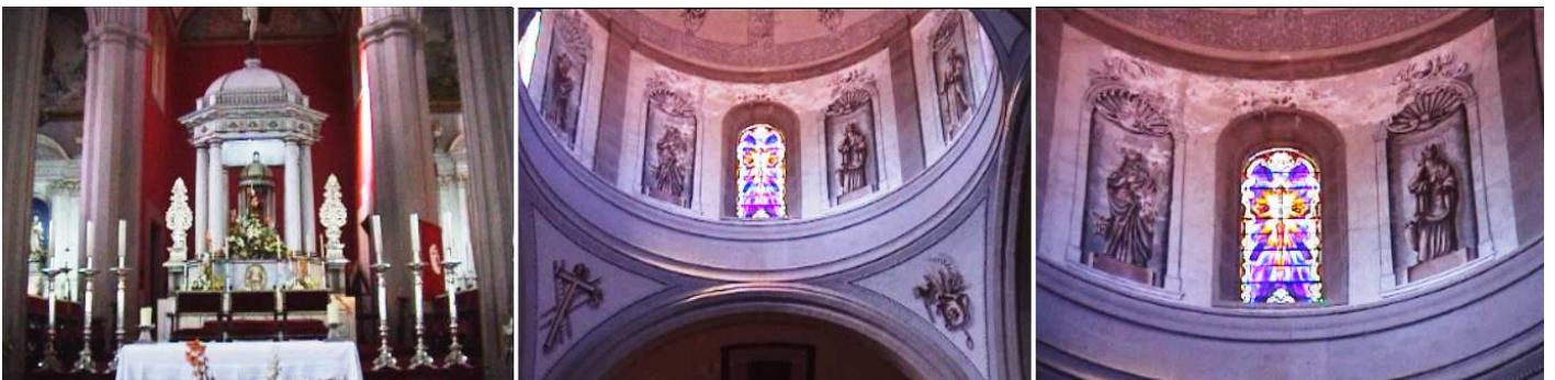
1 Detalle de la Capilla Mayor. En su camarín con trabajos de orfebrería, donde destaca el Cáliz de Plata Mejicano, del S. XVIII. 2 m. 3 - 4 Dos imágenes de la cúpula con los apóstoles y vidrieras sobre sus vanos.

Sobre la cúpula están los signos de los apóstoles, y de la Pasión de Cristo.