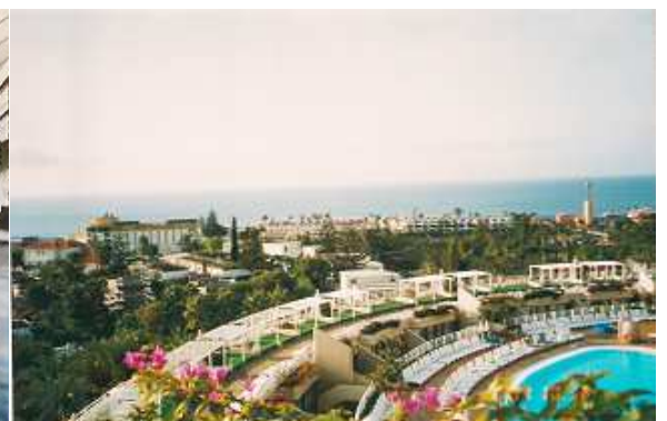
❸ Perspectiva desde el hotel de San Agustín.

Está dotado con un Spa, en las mismas instalaciones del hotel, donde probamos los lodos de mar