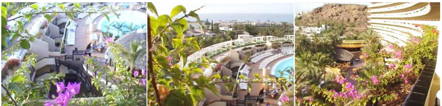
❶ - ❷ - ❸ Diferentes Vistas desde el hotel.

Está dotado con un Spa, en las mismas instalaciones del hotel, donde probamos los lodos de mar