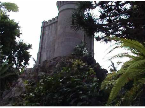
1 Otra parte del jardín.