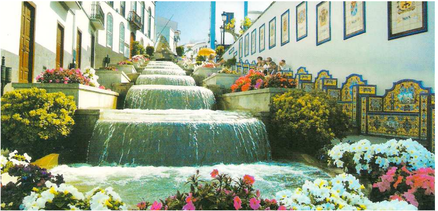
❶ Perspectiva del Paseo de Gran Canaria, con la cascada de más de 30m. y los escudos de los municipios de la isla a la dcha.

En uno de los lados de sus paredes se encuentran los 22 escudos heráldicos que representa a los municipios de Gran Canaria.