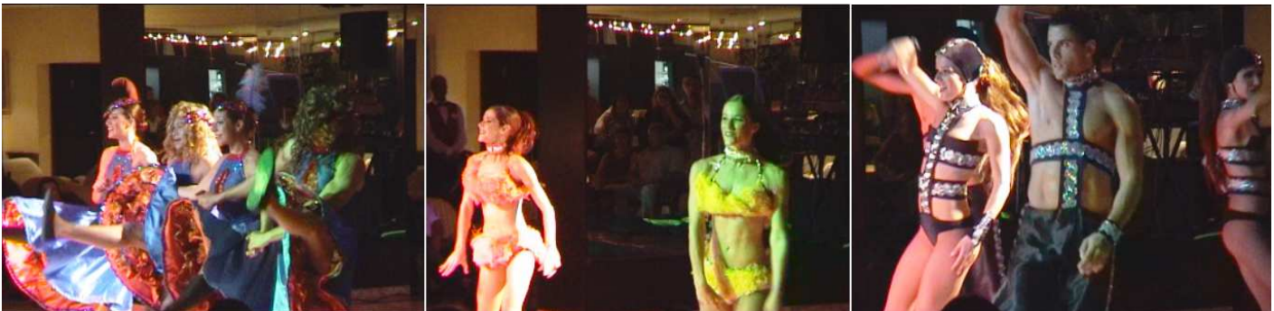
1 - 2 - 3 La verdad es que eran buenas actuaciones para pasar unas divertidas veladas.