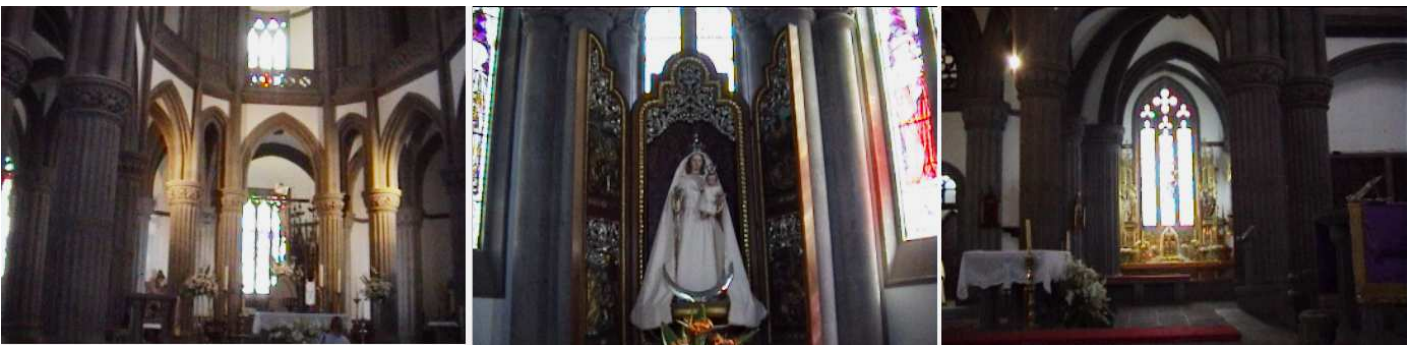
1 Cabecera del templo con el deambulatorio. 2 Capilla de la Virgen. 3 Una de sus vidrieras laterales en la capilla del Santísimo.

Está dotada con hermosas vidrieras, y construida con piedra del lugar.