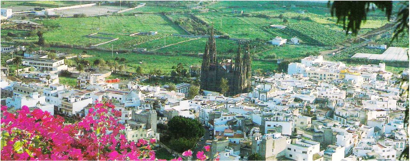
1 Panorámica de Arucas.