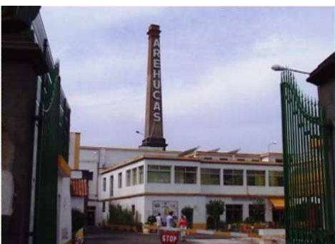
2 Patio de la misma, donde nos reciben para la visita.