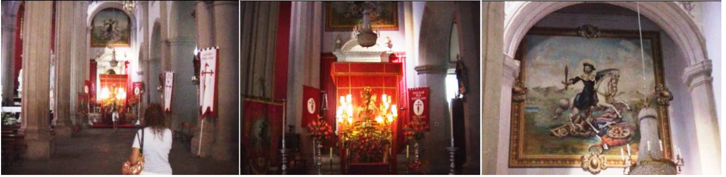
1 Al fondo en la nave de la Epístola esta la capilla de Santiago. 2 La imagen ecuestre de Santiago de los Caballeros, es del S. XVII. 3 Y sobre el retablo podemos observar un fresco del Apóstol Santiago combatiendo contra los moros.

El templo está compuesto por tres naves, separadas por pilares poligonales y cubiertas de bóvedas de medio cañón, dispone de quince capillas repartidas en sus, laterales, y la Capilla Mayor.