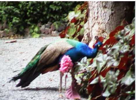
1 Un pavo real suelto.

Una gran tranquilidad, rodea los estanques y arboleda y ofrecen rincones inimaginables