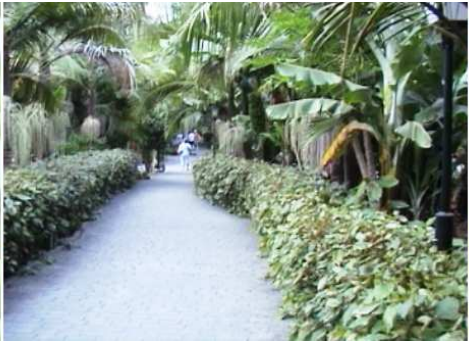
2 Uno de los paseos.