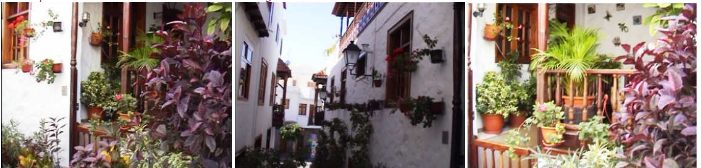
❶ Incluso las entradas de las casas tienen variada decoración floral ❷ Hasta los callejones más estrechos. ❸ Otro detalle de un domicilio.

En esta localidad, merece la pena degustar los pescados en cualquier establecimiento junto al paseo del puerto de las Nieves.