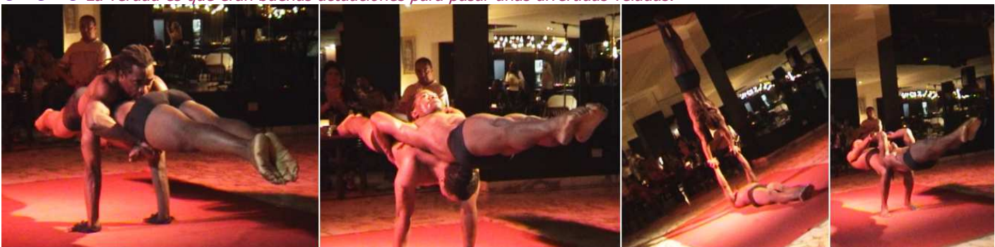
1 x. 2 m. 3 m. 4 m.