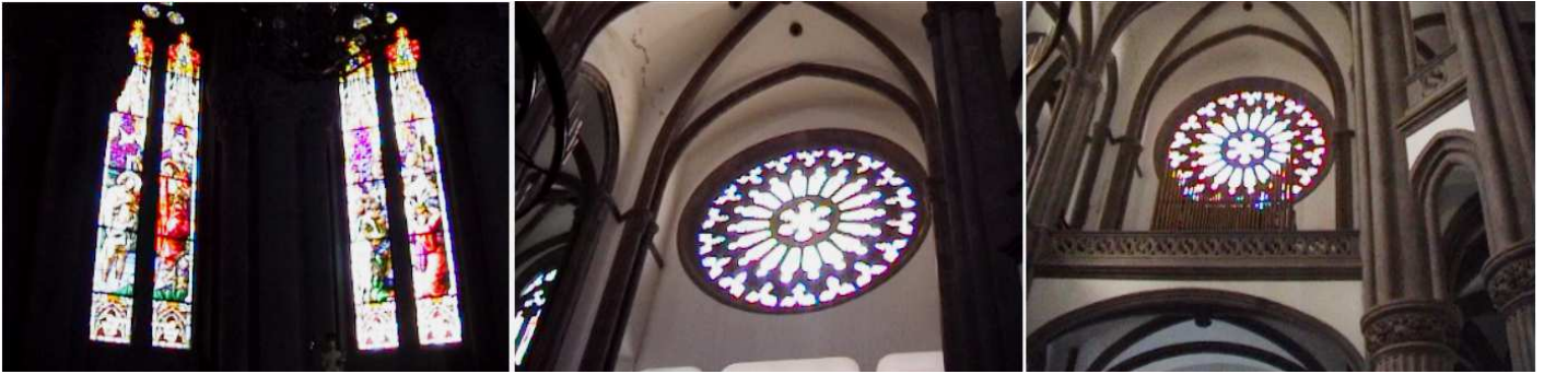
1 Detalle de sus vidrieras. 2 Rosetón del lado derecho del crucero. 3 Detalle del rosetón de la fachada por dentro del templo en el lado del coro con su órgano.

En su altar mayor tiene una talla del S. XVI del Cristo Crucificado, y una escultura de Cristo Yacente.