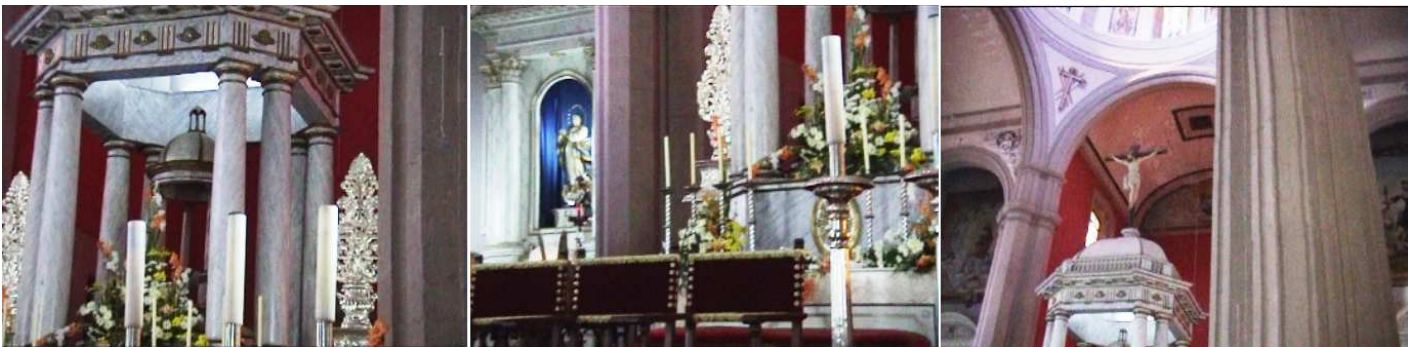
1 Templete del Altar Mayor bajo su cúpula. 2 Detalle del crucero. 3 Templete con un Santo Cristo sobre el mismo.

Sobre el templete de la capilla mayor, en el crucero, se sitúa la cúpula